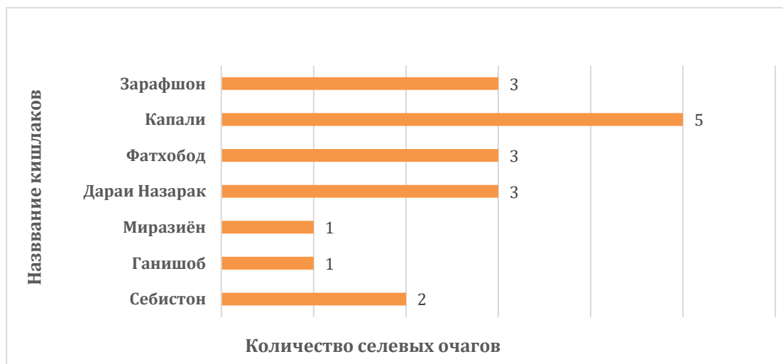
Рис 7. Количество селевых очагов в кишлаках бассейна реки Шураки Капали