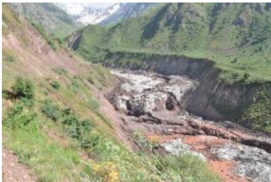
Рис. 3. Снежно-ледовая масса в долине реки Шураки Капали после схода ледника № 504, сентябрь 2017 г.

Повторная активизация ледника произошла в июле 2017 года (между 9 и 11 числом) [Докукин и др., 2019]. Дальность выноса снежно-ледовой массы составила 9,0 км (рис. 3). К счастью, схода селевого потока при этом не наблюдалось.