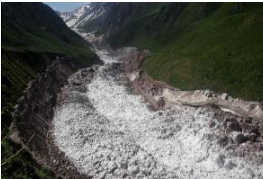
Рис. 4. Снежно-ледовая масса в долине р. Шураки Капали, август 2016 г.

В результате данного события образовалась снежно-грязевая плотина, перегородившая сток реки Шураки Капали (рис. 5). Вследствие этого в верховьях реки сформировалось подпрудное озеро. Быстрый подъем уровня воды в нем привел к его прорыву, сопровождавшемуся сходом селевого потока по реке Шураки Капали. Расходы селя превышали 50 \text{ м}^3/\text{с} .