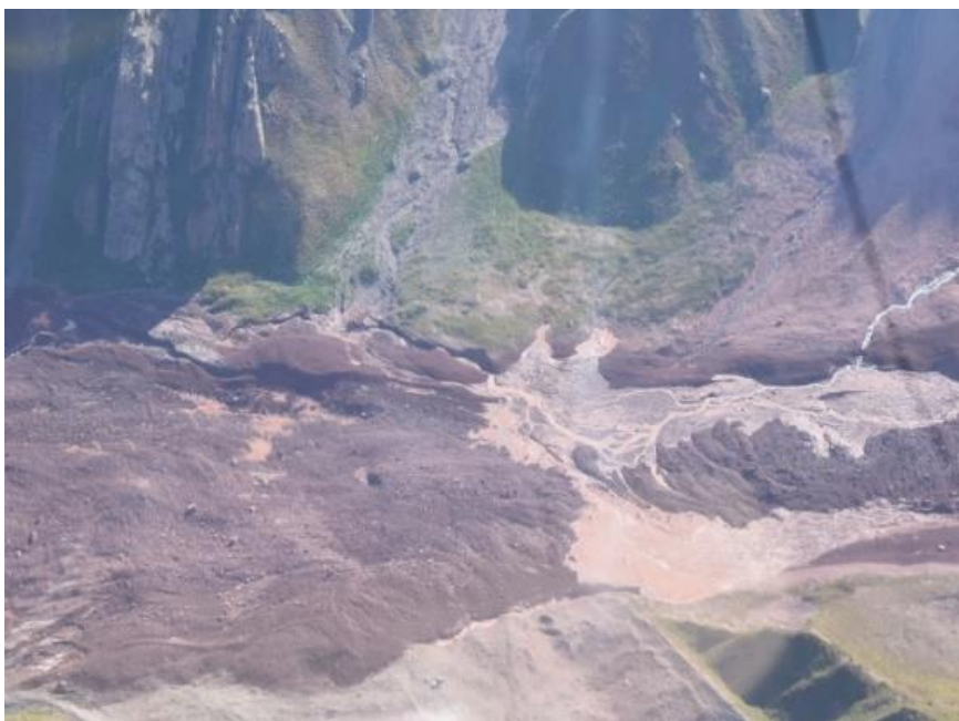
Рис. 5. Снежно-грязевая плотина на р. Шураки Капали, образовавшаяся вследствие схода ледника № 505.