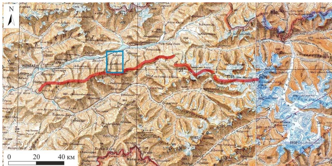
Рис. 1. Общий вид хребта Петра Первого (красная линия) и границы района исследований (голубой прямоугольник) на топографической карте