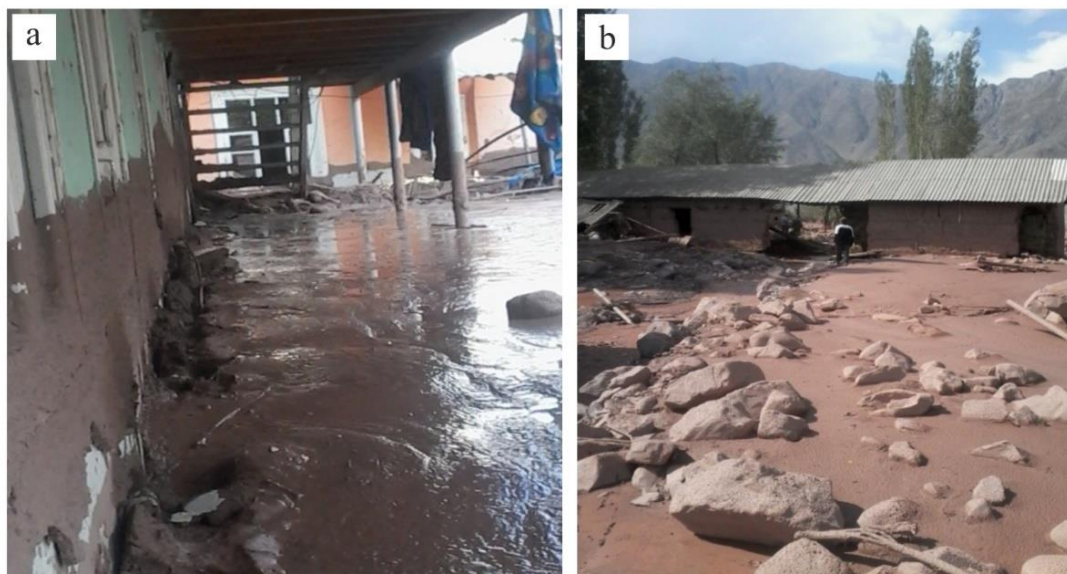
Рис. 6. Грязевая (а) и грязекаменная (б) масса в жилой зоне селений Капали и Фатхобод.

В результате прохождения селевого потока по реке Шураки Капали был разрушен мост между селениями Фатхобод и Шуроба, а также повреждены 25 жилых домов, нанесен ущерб фермерским хозяйствам и коммуникационным системам селений Фатхобод и Капали джамоата Калъаи Лаби Об Таджикабадского района (рис. 6).